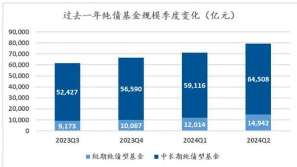
图表 1：过去一年纯债基金规模季度变化（亿元）