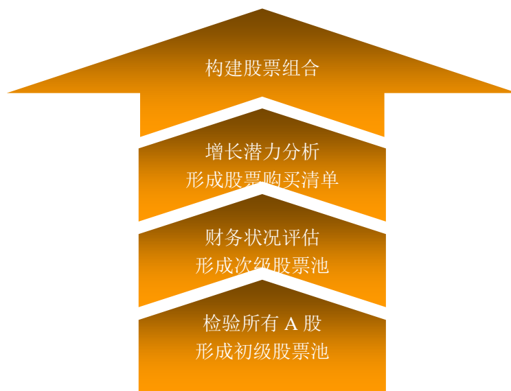
图：本基金选股流程

本基金基金经理将对股票购买清单上的股票进行逐一分析和比较，挑选出其中股价下跌风险最低且上涨空间最大的股票构建具体的股票组合。